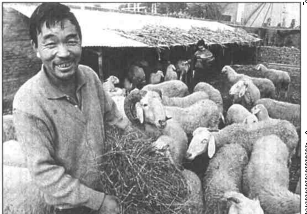
在速引进种羊，办起了小尾寒羊养殖场，今年发展了近百只小尾寒羊。羊王亮高兴地说：俺今年发了羊财啦。